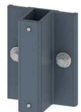
Sabot nez de dalle SND24