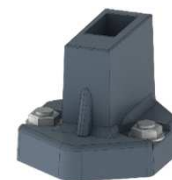
Sabot sur dalle SSD01