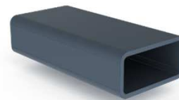
Main courante 50x25 mm